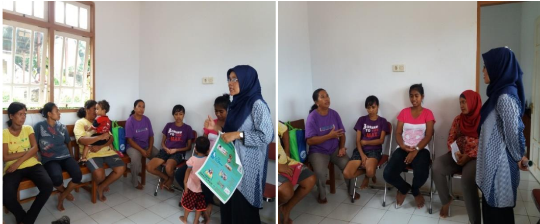
Gambar 1. Penyuluhan

Para kader juga mengusulkan pengadaan alat pengukur panjang/tinggi badan yang sudah rusak ke bidan dan ahli gizi Puskesmas yang hadir sehingga nantinya akan disampaikan ke Kepala Puskesmas Tawiri.