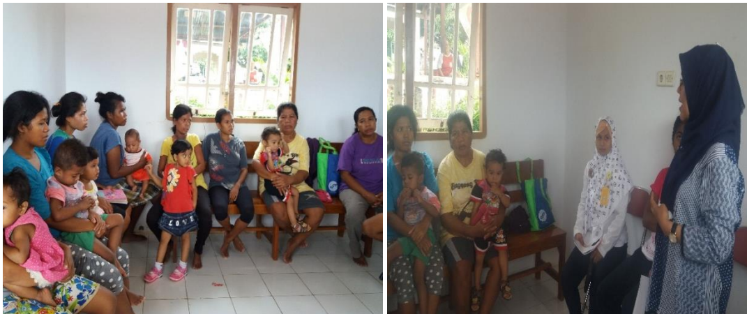
Gambar 2. Penyegaran kader