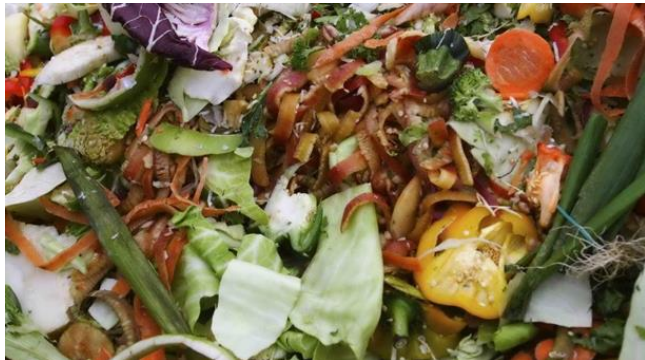
Gambar 1 Sampah Basah