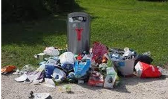
Gambar 6 Sampah Campuran