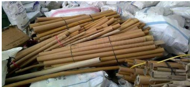
Gambar 2 Sampah Kering

kertas, kayu, kardus, karet dan sebagainya. Sampah yang tidak mudah terbakar sebagian besar berupa zat anorganik misalnya logam, gelas, kaleng yang berasal dari rumah tangga, perkantoran, pusat perdagangan dan lain-lain.