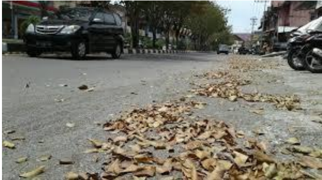
Gambar 4 Sampah Jalanan