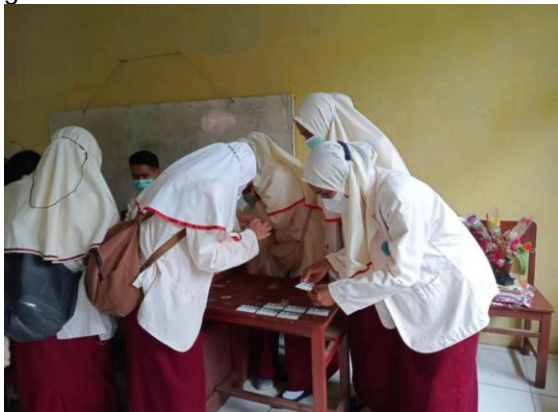
Gambar 1. Pemeriksaan golongan darah

Tahap terakhir adalah siswa melakukan pemeriksaan golongan darah. Sebanyak 30 siswa melakukan pemeriksaan golongan darah dimulai dengan melakukan swab alkohol pada jari, kemudian ditusuk dengan blood lancet. Tetesan darah pertama dibuang, kemudian tetesan darah kedua diteteskan pada kertas golongan darah menyesuaikan lingkaran yang telah tersedia pada kertas. Setelah itu ditambahkan dengan tetes reagen anti A, B, AB dan D dan dihomogenkan. Setelah sekitar 1 menit, hasil pemeriksaan dapat diketahui jenis golongan darah dan rhesusnya terlihat pada gambar 1.