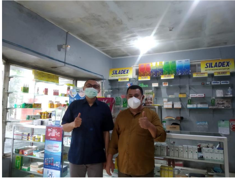
Gambar 2. Foto Kegiatan PKM