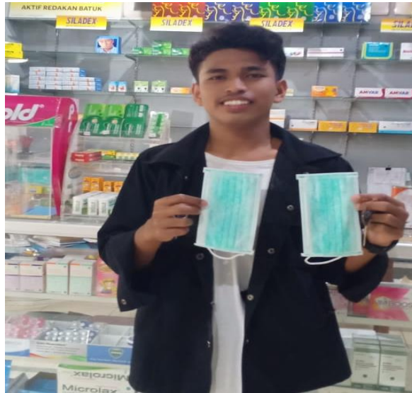
Gambar 4. Foto Kegiatan PKM