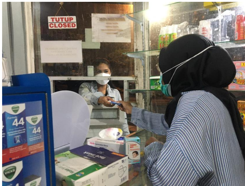
Gambar 3. Foto Kegiatan PKM